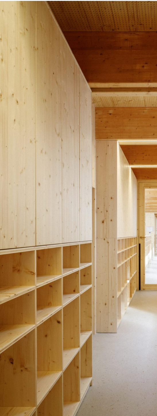
DET 13 principe rangement hall